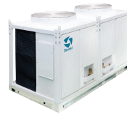
CVA 200,000 -300,000 BTU/HR