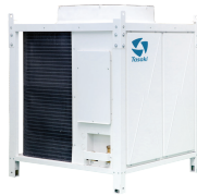
CVA 75,000 -150,000 BTU/HR